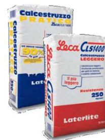
Leca CLS 1400 / Calcestruzzo Pratico per irrigidimenti verticali ed orizzontali