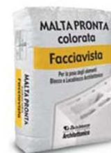
Malta pronta colorata Facciavista (tipo M5)