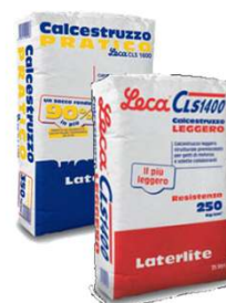
Leca CLS 1400 / Calcestruzzo Pratico per irrigidimenti verticali ed orizzontali